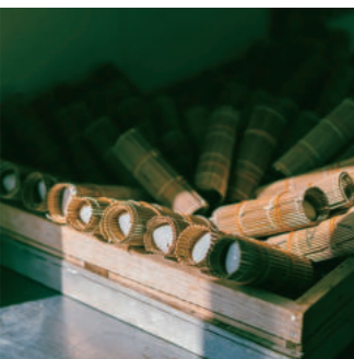
無添加・無着色・卵不使用 ひとつひとつ丁寧に手作りされています

そんな青島の女性たちに伝えられてきた魚のすり身と塩のみで作られる伝統製法の「青島かまぼこ」です。海を眺めながらエソをひとつひとつ丁寧に捌いて手作りされます。無添加・無着色青島の海のみが詰まらされたかまぼこは素朴な味わいで、透き通った青島の海の香りがします。