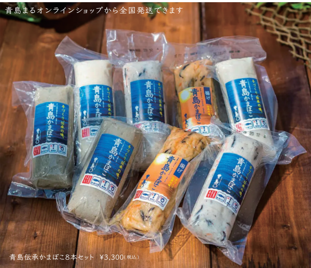
青島伝承かまぼこ8本セット ¥3,300(税込)