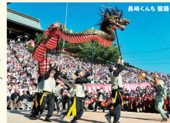
長崎くんち 龍踊り

また、長崎は香港・モナコとともに、世界を代表する夜景都市「世界新三大夜景」都市として認定されています。その他、世界遺産の教会や軍艦島・グラバー園・中華街など、数多くの歴史的名所がある観光都市です。西九州新幹線で長崎を訪れて見てはいかがでしょうか。